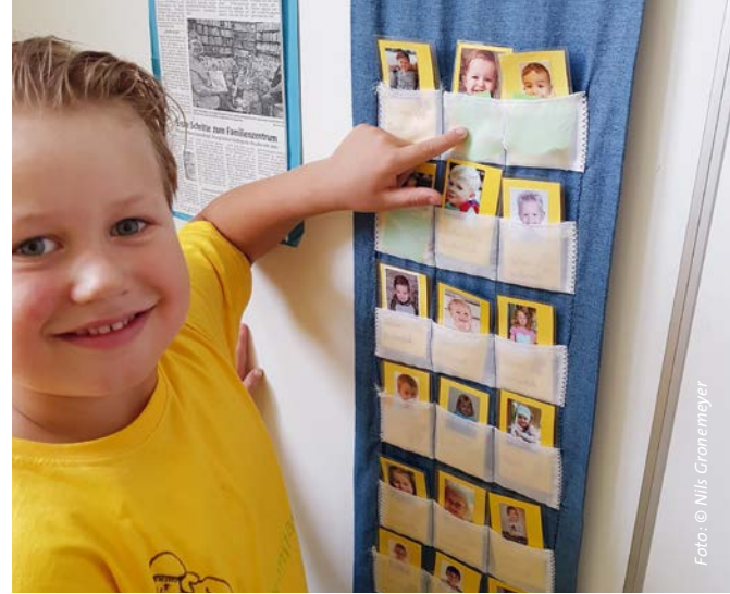
Jedes Kind hat einen eigenen Büchereiausweis.

Doch auch wenn Bücher einen hohen Stellenwert haben, verzichtet die Einrichtung nicht komplett auf Technik. Die Kita hat einen Laptop mit Lernprogrammen, an dem die Kinder den Umgang mit einem Computer lernen. Im Vordergrund steht hier vor allem die Lernwerkstatt, ein Programm, das von vielen Schulen verwendet wird. Während dort primär die Spiele für Mathematik und logisches Denken genutzt werden, konzentriert sich