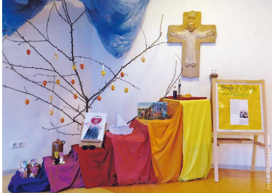
Stufe für Stufe bis Ostern: Im Laufe der Fastenzeit wächst die Ostertreppe weiter an.