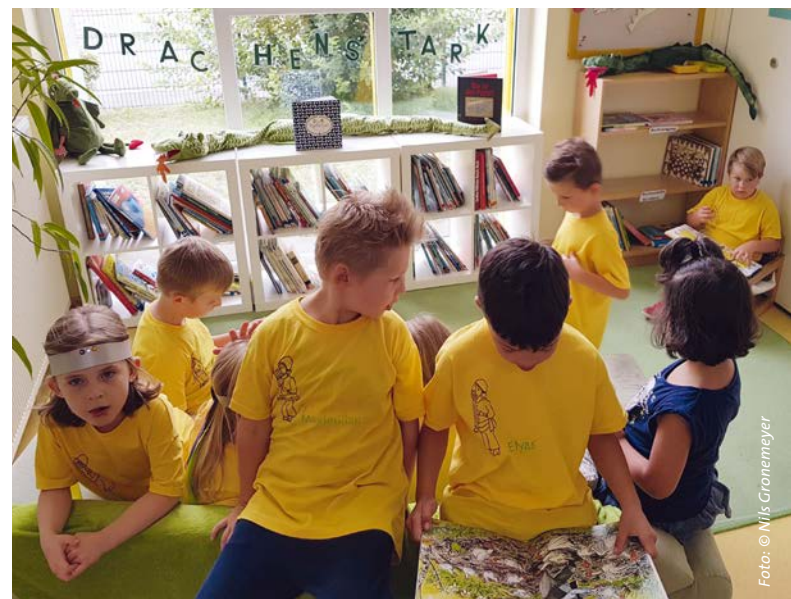
Die Maxi-Kinder lesen in der Bücherei „Drachenstark“.